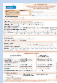
DAP DIF CDD

➔ Imprimé téléchargeable sur le site www.unifaf.fr