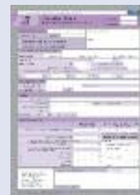
DPC formation tuteur

Imprimés téléchargeables sur le site www.unifaf.fr